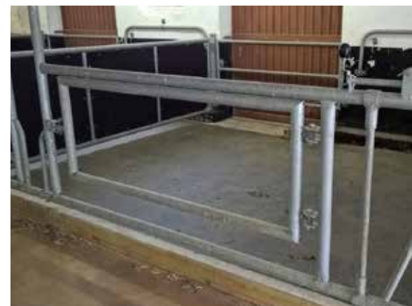
ingebouwde VITA met zwenkbaar hekwerk op testbedrijf Köllitsch