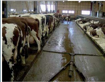
solda: beslenme alanı

Yem aldığı beslenme yeri zemini yumuşak hijyenik ve kauçuk ile kaplı ise